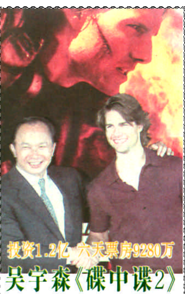
投资1.2亿 六天票房9280万 吴宇森《碟中谍2》 再创大片票房神话

便是浪费纸张。”在这篇名义是悼鲁迅的文章中，林语堂给鲁迅画了两幅“活形”，鲁迅近乎街头寻衅耍赖的“牛二”。 朱振国在公开信中说：“对待历史人物，尤其是文化伟人，我们需要保持明智的心态，宗师、奠基人、开先河者，有其不完善之处是难免的，但他们的历史地位永远是不可动摇的。想以巨人的轻侮衬托自己的高明，或以为巨人已长眠地下不可能辩证和抗争而显得猖狂，只能证明自己的愚蠢、浅薄和卑劣。” 朱振国敦促中国作家协会“以严肃的态度关注此事，给读者和会员一个明确的说法。作协的领导，对肆意贬损、侮辱鲁迅等大师级文学前辈的现象应有正确的立场和态度”。 目前，关于鲁迅的书在国内仍然畅销，一般书店里都有各种各样鲁迅作品的版本。3年前，曾有出版社因为争夺鲁迅全集的版权而打过笔墨官司。两年前，一本题为《一个都不宽恕》的书因为收集了大量攻击鲁迅的文章也一度“走红”书市。（据新华社）